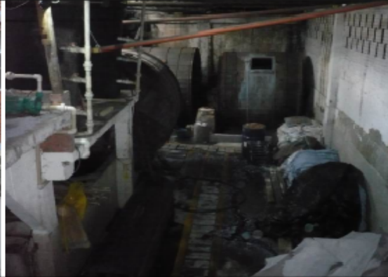
Foto No. 2 Proceso productivo