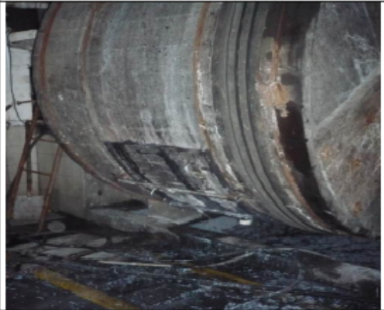
Foto No. 3 Bombos de proceso húmedo