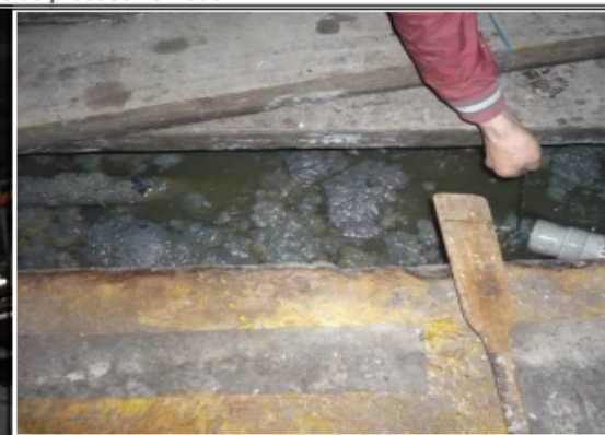
Foto No. 6 Trampa de grasas.