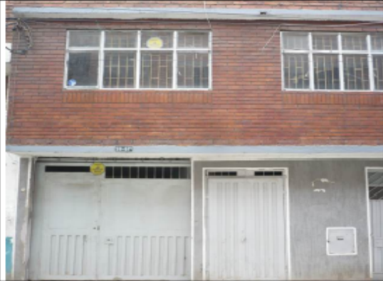
Foto No. 1 Fachada del establecimiento