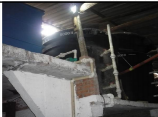
Foto No. 5 Sistema de tratamiento de ARnD.